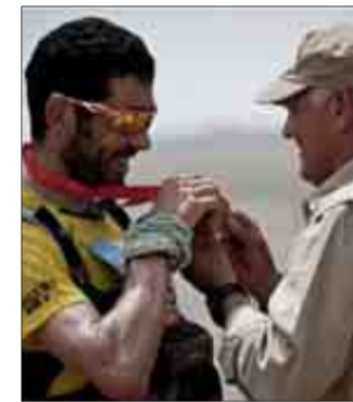
Capó, recogiendo su medalla.

La etapa se planteaba muy dura después de toda la semana de supervivencia y a priori parecía imposible recortar la